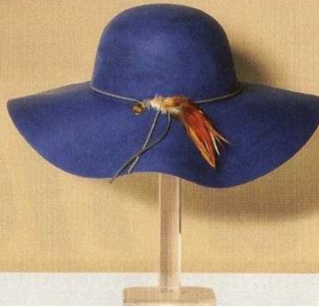
Boho style In panno di lana con piuma décor, Met (€40).