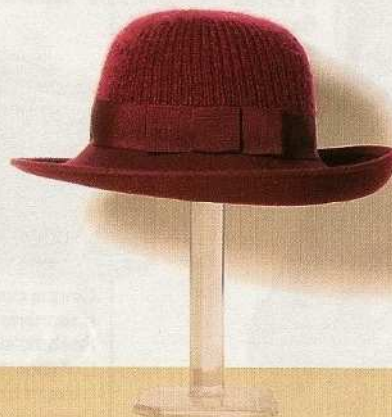
Doppia texture In panno e lana a coste, Gazel (€116).