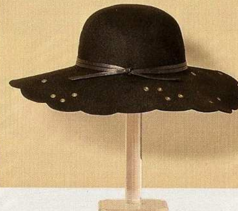
Borchie Con falda sagomata e fascetta in pelle, Marzi Firenze (€185).