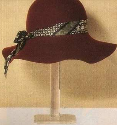
Foulard Con fascia in seta stampata, Aniye by (€89).