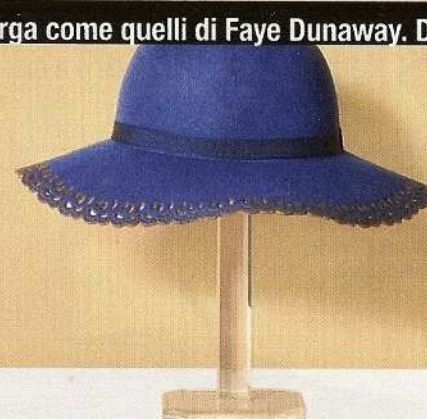
Laserato Con lavorazione effetto pizzo, Rinascimento (€50).