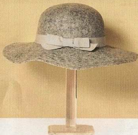
Mélange In feltro con fiocco in gros-grain, Blugirl (€110).