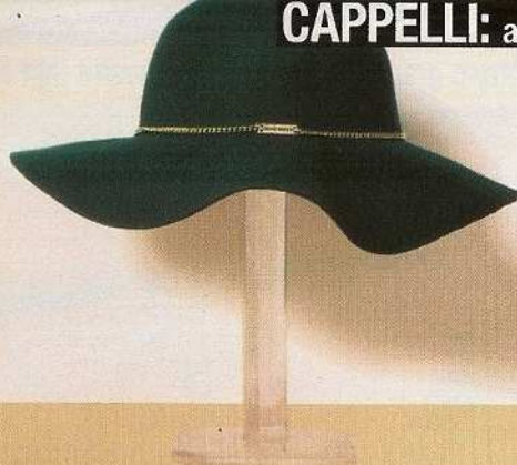
Smeraldo In panno con catena argentata, Miss Sixty.