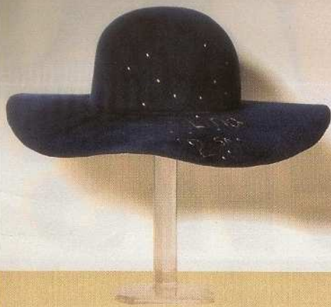
Ricamato Con lettering a contrasto, Borsalino (€450).