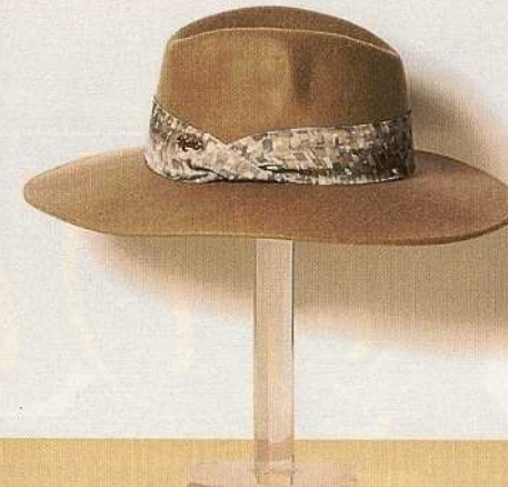
Cammello In lana con fascia in seta, Kocca.